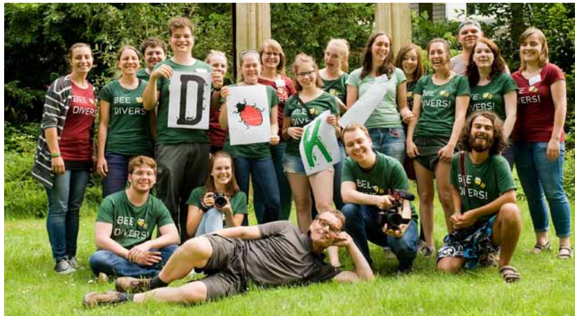
Schreiben, fotografieren und filmen – das Dokuteam