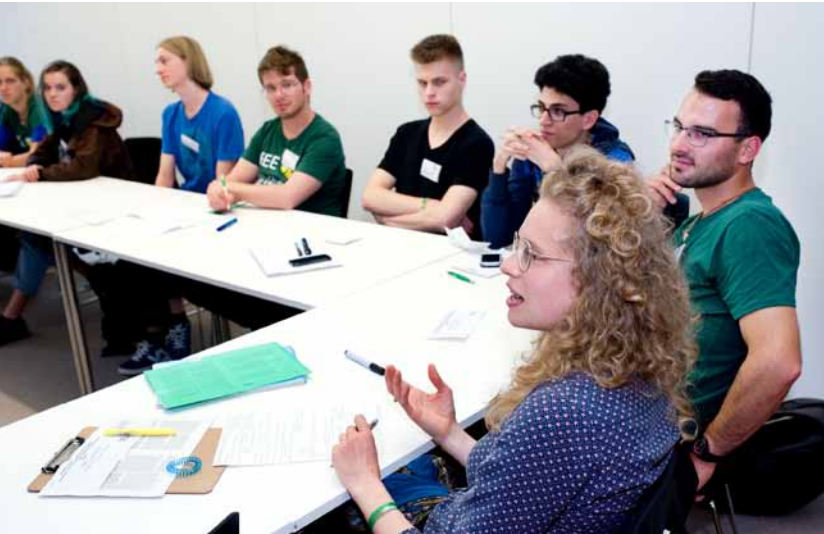
Engagierte Diskussionen unter den Teilnehmerinnen und Teilnehmern