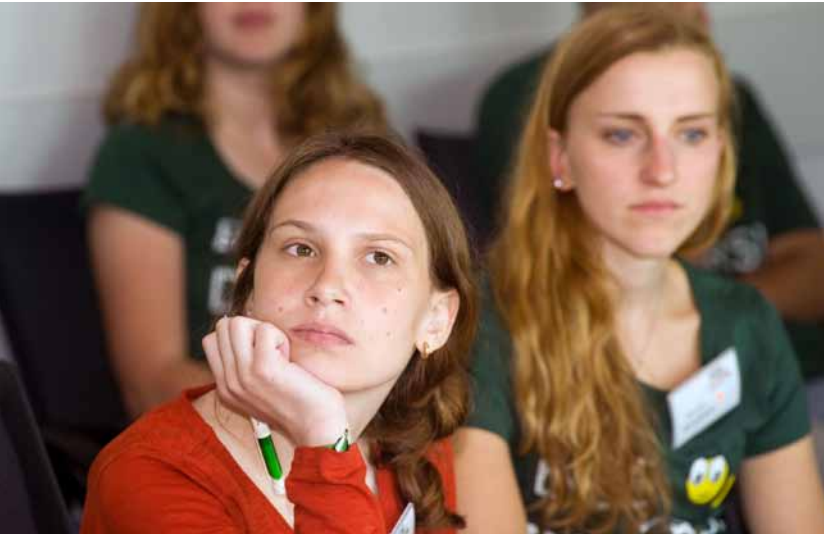
Aufmerksame Teilnehmerinnen und Teilnehmer im Workshop »Buen vivir – Nachhaltigkeit (er)leben«