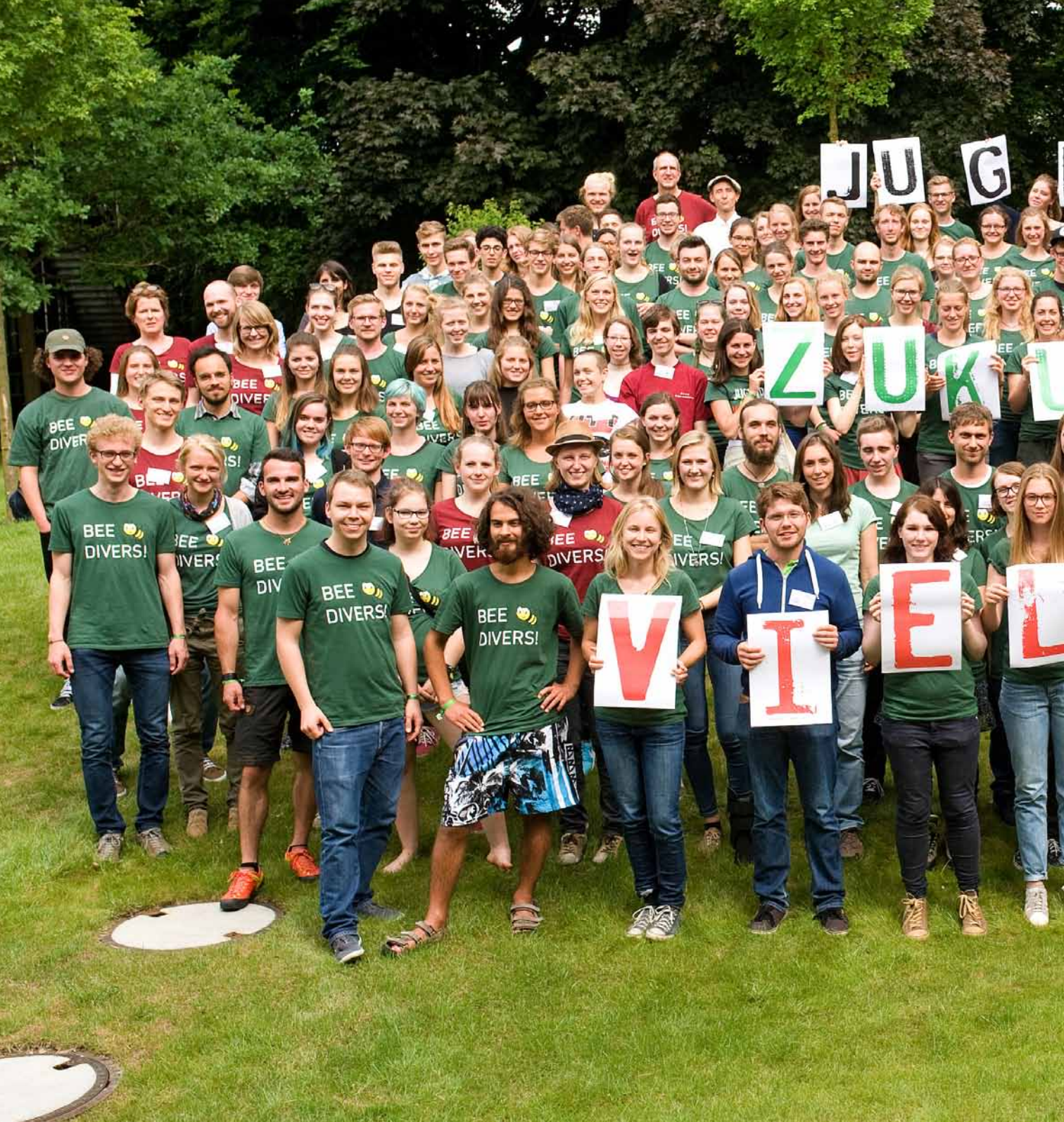
Diese 180 Menschen machten den Jugendkongress Jugend | Zukunft | Vielfalt zu einem unvergesslichen Ereignis.