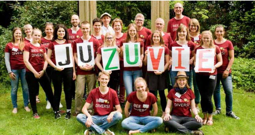
Das Orgateam mit den Unterstützenden von BMUB, BfN und DBU