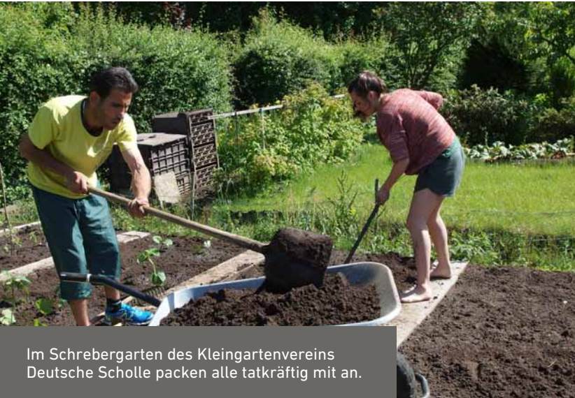
Im Schrebergarten des Kleingartenvereins Deutsche Scholle packen alle tatkräftig mit an.