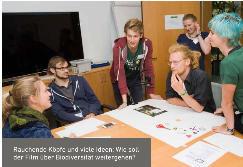
Rauchende Köpfe und viele Ideen: Wie soll der Film über Biodiversität weitergehen?

Jedes einzelne Gen, jede einzelne Art für sich scheint zunächst entbehrlich zu sein, doch nur zusammen formen sie Ökosysteme, interagieren miteinander und erfüllen ihre Funktionen im großen Ganzen, das eben doch mehr ist, als die bloße Summe seiner Teile.