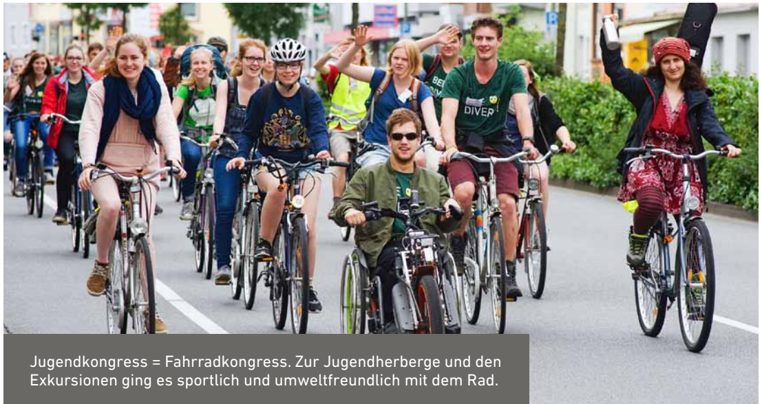
Jugendkongress = Fahrradkongress. Zur Jugendherberge und den Exkursionen ging es sportlich und umweltfreundlich mit dem Rad.

Waage? Was lassen sich Pflanzen einfallen, um bestäubt zu werden? Inwiefern lassen sich Wildblumenwiesen mit Urwäldern vergleichen? Es ist wichtig, dass uns als Gesellschaft bewusst wird, wie wichtig Biodiversität für uns ist. Sie schenkt uns nicht nur Freude, sondern ist für uns eine Lebensgrundlage.