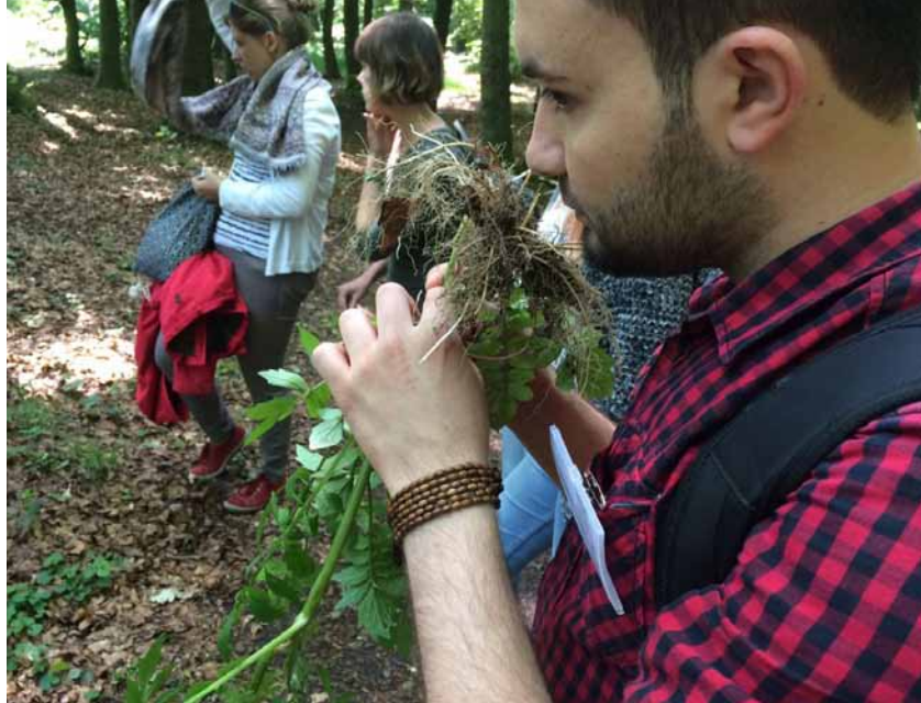
Einmal schnuppern, bitte – die Stadtnatur wird mit allen Sinnen erkundet.

Eine Menge Wildnis in Osnabrück also. Wenn auch urban, sozusagen menschengemacht. Ohne uns wäre hier Wald. Aber dort hat der Wert dieser Wildnis seine Wurzeln. Unser Einfluss auf die Landschaft über mehr als