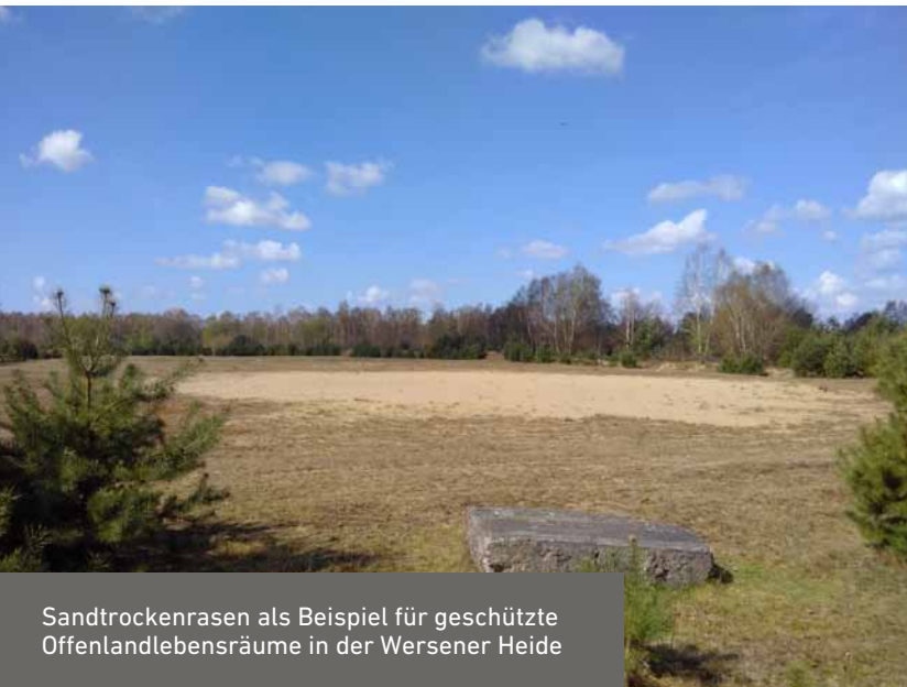
Sandtrockenrasen als Beispiel für geschützte Offenlandlebensräume in der Wersener Heide

Am Ende führte uns das wieder zum Thema Wildnis: Sollte man die Natur Natur sein lassen oder besondere Kulturlandschaften pflegen? Auch wenn wir auf diese Frage keine klare Antwort finden konnten, so hat uns der Ausflug in die Wersener Heide sicher einige interessante Denkstöße geben können.