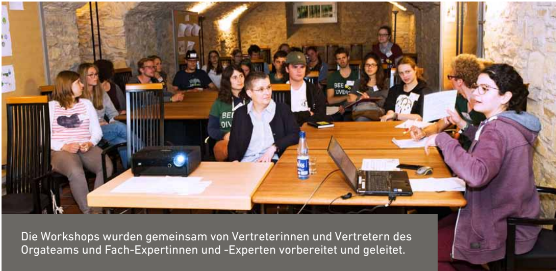
Die Workshops wurden gemeinsam von Vertreterinnen und Vertretern des Orgateams und Fach-Expertinnen und -Experten vorbereitet und geleitet.